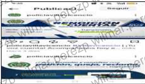
Banner - Publicación Instagram