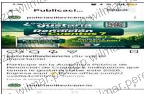
Encuesta temas de interes – Instagram