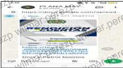
Publicación por grupos internos y externos whatsapp