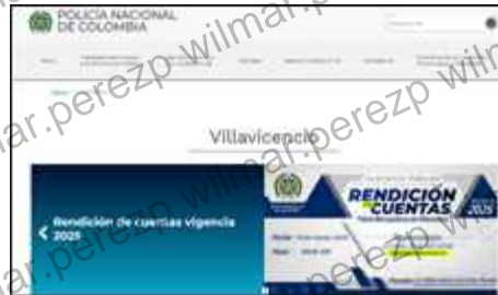
Banner - Publicación Pagina Web